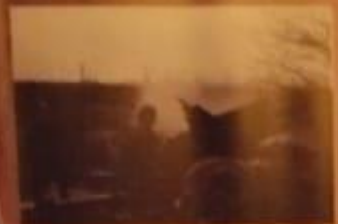
Солдаты Красной Армии в лагере Аушвиц, январь 1945 г.

В день освобождения лагеря Аушвиц участвовали представители 29 национальностей СССР.